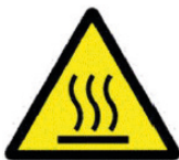
אזהרה טמפרטורה גבוהה

C: דלת טאבון הפיצה משמשת גם לחימום מראש וגם במהלך אפיית הפיצה.