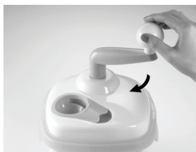
4. מקם את חלקו העליון של המעבד על הקערה.