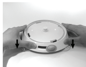
3. הזז את הכפתור על מנת לנעול או לשחרר את הקערה.