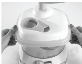
5. הדק את שני התופסנים על מנת ולקבע את חלקו העליון של המעבד.