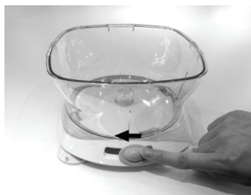
1. נקה את הגומיות בבסיס המעבד, לחץ את הבסיס אל המשטח תוך כדי הפעלת כח

לפני השימוש, אנא קרא בעיון את הוראות ההפעלה.