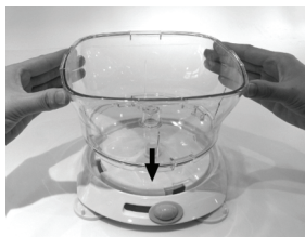
2. מקם את הקערה השקופה בבסיס המעבד לפי ארבעת החריצים.