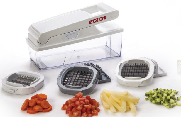
SLICER PRO \ CLASSIC \ PREMIUM