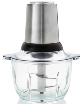
MASTER SLICER PULSE