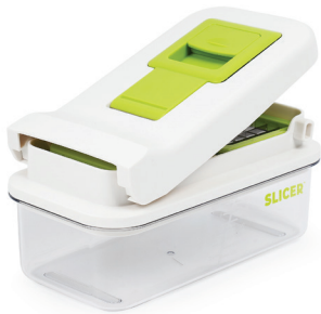
SLICER CUBIC \ SUPER BOX

הצטרפו ללמעלה מחצי מיליון ישראלים שכבר לקחו את הבריאות בידיים, במהירות. עם משפחת סלייסר המקורית, הקוצצים ומעבדי המזון הידניים, הירקות נחתכים בקלות ובמהירות לסלטים טריים יותר, השומרים על ערכיהם התזונתיים. אתם מוזמנים להעשיר את מגוון הארוחות שלכם בסלטים, רטבים, תערובות ביצים ואפילו ייבוש עשבי תיבול. לבריאות.